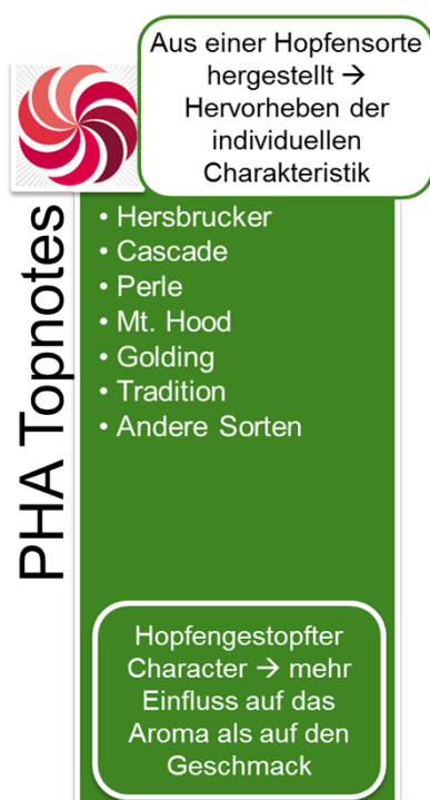
Abbildung 1: PHA® Topnotes

Die PHA® Topnotes Produkte werden mittels spezifischer Extraktions- und Destillationsmethoden aus Hopfen hergestellt. Dabei liegt das originäre Hopfenöl in einer Propylenglykol-Lösung vor. Propylenglykol ist ein anerkannter Zusatzstoff gemäß der EU Richtlinie 2006/52/EC. Die PHA® Produkte werden weltweit ausschließlich von BarthHaas vertrieben.